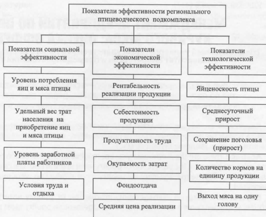
Рисунок 1 – Основные показатели эффективности птицеперерабатывающего подкомплекса [составлено автором для ООО «Комплекс Агромарс»]

Птицеперерабатывающий подкомплекс – органичная составная часть национального и регионального АПК. Функциональное предназначение агропромышленного комплекса состоит в следующем: наиболее полное удовлетворение потребностей населения в продовольствии (качественные яйца, мясо и продукт их переработки), благодаря его доступности для всех слоев населения; обеспечение достаточного уровня денежных доходов, занятых в подкомплексе работников; обеспечение экологических параметров производства. Если птицеперерабатывающее предприятие успешно решает поставленные перед ним задачи, то его функционирование можно считать эффективным. Степень достижения поставленных целей является характери-