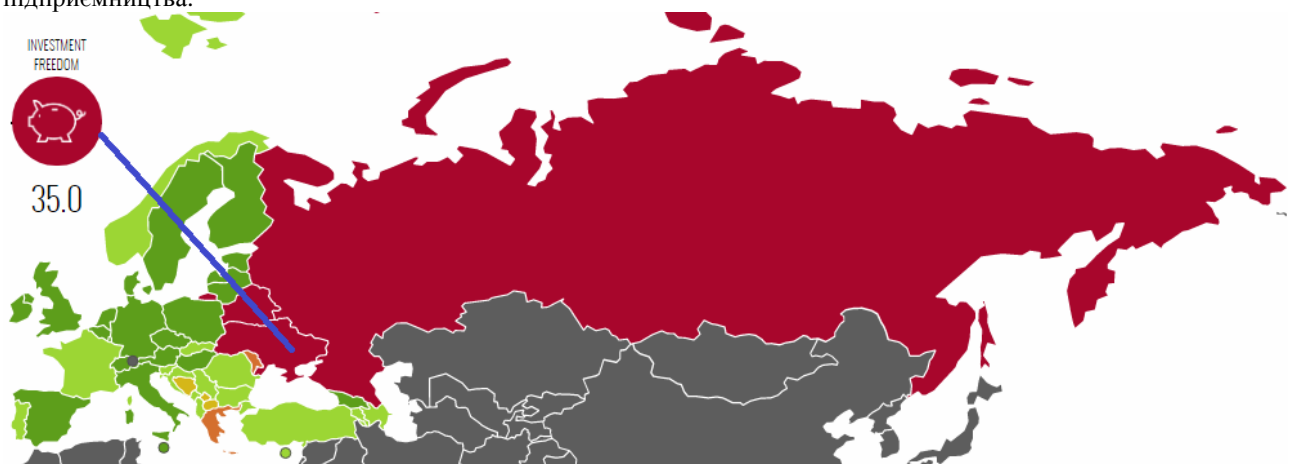
Рис. 3. Рівень незалежності інвестування в Україні серед інших країн Європи у 2020 році: інфографіка

Для оцінки привабливості інвестування України слід зупинитися ще на аналізі індексу інвестиційної незалежності (рис. 3), який станом на 2020 рік становить 35. Використовуючи ту саму шкалу, що й для визначення рівня економічної свободи отримуємо, що Україна відноситься до групи із залежним інвестуванням, потребує притоку інвестицій для забезпечення розвитку галузей та інноваційного підприємництва.