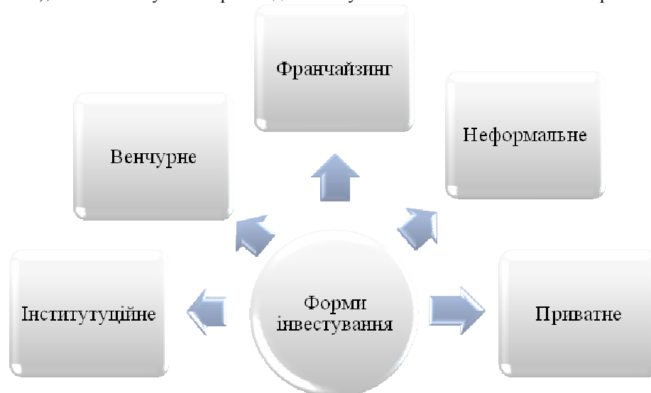
Рис. 1. Сучасні форми інвестування інноваційного підприємництва

Отже, поширеними формами інвестування інноваційних підприємств та підприємництва є: приватні інвестори, венчурні фонди, франчайзинг (рис. 1). Виникають ситуації, коли не завжди засновники або власники мають змогу вкладати кошти у подальший розвиток своєї справи та вимушені підшукувати тих, хто готовий проінвестувати їх інноваційні ідеї. Інколи інноваційна підприємницька ідея є високоризиковою й знайти інвестора важко. Саме тому, з плином часу, з'являються нові форми інвестування, зокрема неформального типу (зазначено на рис. 1), які наштовхують на розгляд питань у контексті можливості їх використання в Україні.